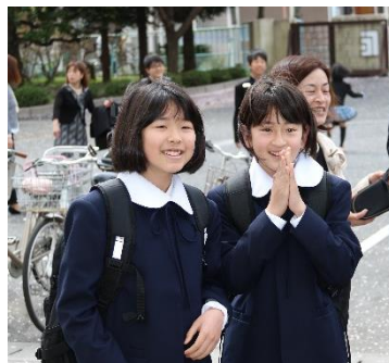
【ドキドキのクラス発表】