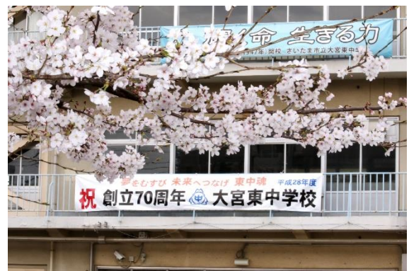
【創立70周年記念の横断幕】

昨年度途中から火曜日、木曜日の朝の職員集会をやめて、全員で正門、東門に出てあいさつ運動をしています。子どもたちの朝の声と表情は、一人ひとりの心のバロメータだと思います。職員室で「きょう〇〇君元気なさそうだったぞ」とか「〇〇さん、昨日怒られたけど、今日はとてもいい表情でした」などと言う声が上がります。朝のわずかな時間ではありますが、今後も大切にしていきたいと思っています。