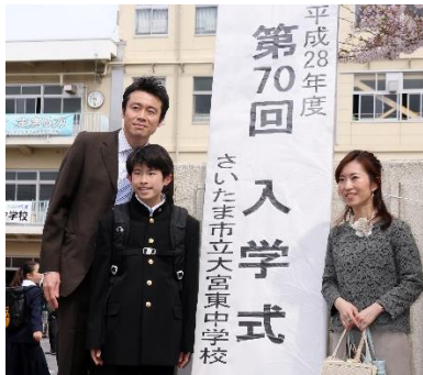
【正門の前で記念撮影】