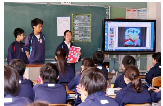
【視聴覚機器を使って読み聞かせを実施】

「私たち図書委員(2、3年生)の今年度初の大仕事となりました。およそ1週間前から準備・練習をしてきました。1年生はとても真剣に聞いてくれ、また笑い声も聞こえ、とてもうれしくやりがいを感じました。1年生のみなさんが図書室に足を運んでくれるきっかけになったらよいです。」図書委員会ご苦労様でした。読書の習慣が一層定着するように今後も活動を充実させてください。