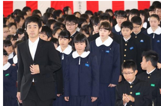
【堂々とした入場の様子】