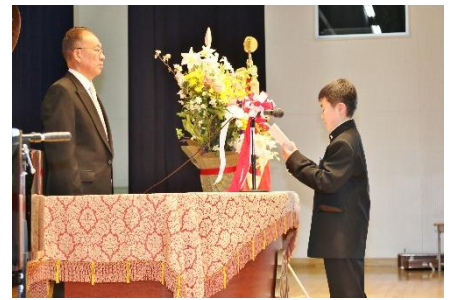
【東中の一員としての決意】

「僕たち新入生149名は夢と希望をもって、今日大宮東中学校の校門をくぐりました。新しい先生、新しい友達、新しい授業、新しい制服。全てが新しい環境で、僕たちは新しい一歩を踏み出す決意をしました。中学校では数多くの行事があると聞いています。体育祭、部活動の大会、定期テスト、未来くるワーク体験、2年生での館岩自然の教室、3年生での修学旅行。こうした一つひとつの行事をとおして仲間たちとの絆を深め、三年間を実りあるものにし、今年70周年を迎えた伝統ある大宮東中学校をさらに発展させていく決意です。最後に、これからの3年間、どんな困難も仲間と協力して乗り越えていくことを誓って新入生誓いの言葉とします。」