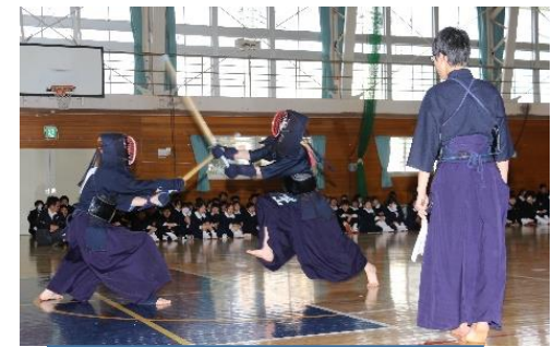
上：生徒会役員による説明 下：部活動紹介の1コマ