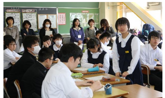
【3年生の授業参観より】

4月14日(金)に、今年度初めての授業参観が実施されました。新年度がスタートしたばかりでしたが、当日はたくさんの保護者に授業を参観いただきありがとうございました。1学年進級したお子様たちの授業の様子はいかがでしたでしょうか。授業参観に続き、全体保護者会・学級懇談会・PTA役員決めという次第でした。今年度PTA役員になられた方々には1年間お世話になります。東中の職員一同、教育活動に勇往邁進いたしますので、ご協力お願いいたします。