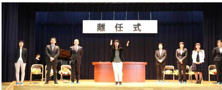
離任された先生方に心をこめて「最高の校歌」を送りました。