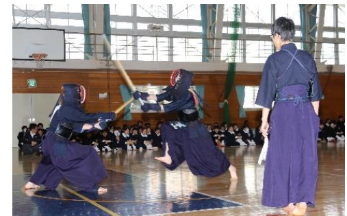
上：生徒会役員による説明 下：部活動紹介の1コマ