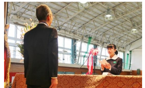
【新入生代表の言葉】

「私達148名は、夢と希望に向かって、今日新しい制服に身を包み、この大宮東中学校の門をくぐりました。何もかもが新しい環境で、未来への一步を踏み出しました。中学校では、初めて経験することがたくさんあると思います。教科担任制の授業、部活動、小学校にはない行事、そして今日入学した同級生との出逢い。私たちの心は、期待と不安で満ちています。(略) 新たな経験の中で、悩んだり、落ち込んだりすることもあると思います。そんな時は、自分自身の努力、友達との協力など、小学校での経験を生かし、乗り越え成長していきたいと思います。まだ、未熟な私たちですので、うまくいかないこともあるかと思いますが。その時は、諸先生方、先輩の方々にご指導いただき、見守っていただけたら嬉しいです。中学生らしく、自分の言葉や行動に責任をもち、何事にも全力で取り組み、実りある中学校生活を送りたいと思います。」