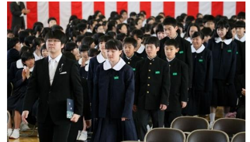
【担任を先頭に堂々と入場】