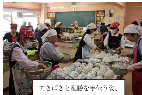
ときばきと配膳を手伝う姿、 感心です。

大宮中部地区社会福祉協議会主催の会食サービスは、部活動単位で生徒がボランティア参加しており、家庭や学校生活では見られない生徒の一面も見られます。保護者の皆様もぜひ見学にいらしてください。6月の開催は9日(土)で野球部が参加します。