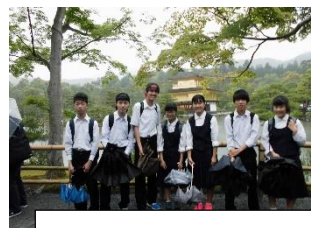
歴史ある建造物 たくさんの出会い