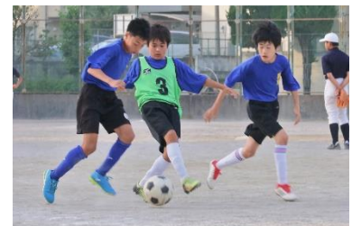
学校総合体育大会に向けて、どの運動部も練習に熱が入っています。ファイト、東中生！