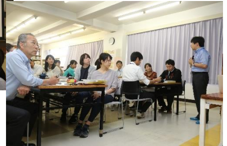
【5月21日(月) 校内研修】 よりよい授業の在り方を研究するために、講師を招いて先生方の 勉強会を実施しました。全員、真剣なまなざしです。