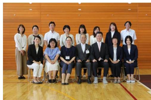
平成30年度の本部役員の皆さんです。

5月25日(金)、本校体育館において平成30年度PTA総会が開催されました。予定された議案は全て承認され、無事に総会が終了したことをまず皆様へご報告いたします。ご協力ありがとうございました。また、平成29年度PTA役員の皆様には、日頃から細やかな気配りで学校をバックアップしていただき、大変お世話になりました。心から御礼申し上げます。本総会をもちまして承認された平成30年度の役員の皆様、1年間どうぞよろしくお願いたします。