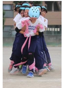
体育祭に向けて、熱い練習がスタートしています。