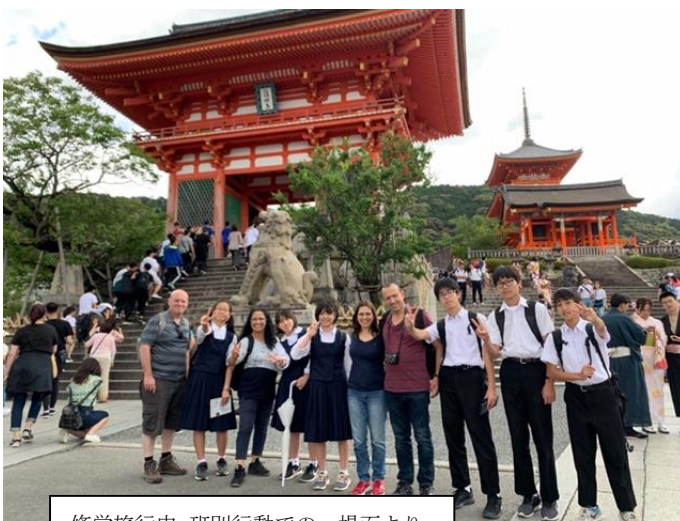
修学旅行中、班別行動での一場面より。

もうすぐ夏休みです。何かと忙しい中学生ですが、折角の長い休みです。家族や地域の方々とコミュニケーションをとったり、本物の自然や芸術・文化に触れたりするなど様々な実体験を積んで夏休みを有意義に過ごしてほしいと願っています。