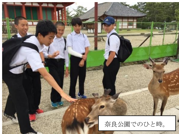
奈良公園でのひと時。

6月15日（土）から2泊3日で、3年生は京都・奈良への修学旅行へ出掛けてきました。古の歴史や文化遺産に触れたり、多様な人々との触れ合いを通して豊かな体験をしたり、天気にも恵まれ充実の3日間だったそうです。以下、実行委員長の言葉です。