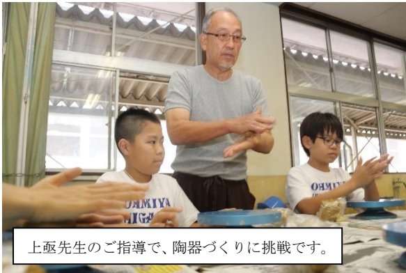
上亟先生のご指導で、陶器づくりに挑戦です。

今年度からスタートした放課後チャレンジスクールが、中間テスト前5月22日(水)・23日(木)に行われました。学習アドバイザーの支援や教材等の提供を行い、生徒に自主学習の場を提供しましたが、生徒のアンケートでは、「しっかり計画を立てて自主学習が進められた」「静かな学習環境の中で集中して学習できた」など、生徒にとってよりよい自主学習の場となりました。